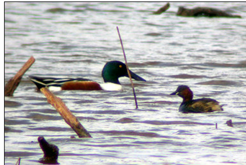
Foto 1. Cullerot ( Anas clypeata ) i soterí petit ( Tachibabtus ruficollis )

A l'hora de representar les dades i per facilitar l'anàlisi posterior, algunes de les espècies apareixen agrupades en conjunts de característiques ecològiques similars, com per exemple la dieta o la salinitat de les aigües que prefereixen. Seguidament es descriuen les agrupacions fetes: