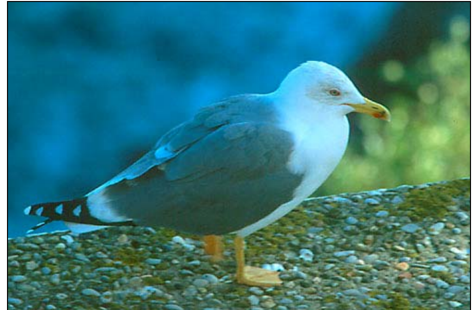
Gavina camagroga ( Larus michahellis )

El present indicador mostra l'evolució durant anys 80 i 90 de les colònies de gavina camagroga a Menorca. Es pretén anar actualitzant l'indicador a mesura que s'obtinguin més dades comparables.