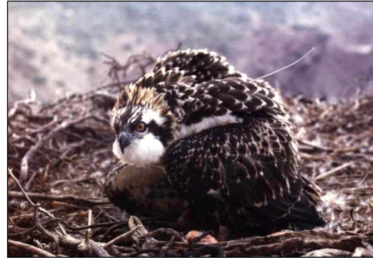
Foto 1. Poll d'àguila peixatera ( Pandion haliaetus ) Autor: Rafel Triay

El gran descens sofert per la població durant els anys seixanta i setanta, fins arribar a trobar-se en perill d'extinció com a nidificant a l'illa, ha impulsat, des de llavors, la realització de diversos estudis i actuacions entorn seu. Seguint els criteris de la UICN està catalogada com a espècie en perill d'extinció en el Catàleg Nacional d'Espècies Amenaçades, ja que en tot l'estat espanyol només nidifica a les illes Balears, Canàries i Xafarines i la població total oscil·la al voltant de les 30 parelles. A les Illes Balears amb un contingent estimat de 18 parelles està catalogada com a espècie "Vulnerable" en el "Llibre vermell dels Vertebrats".