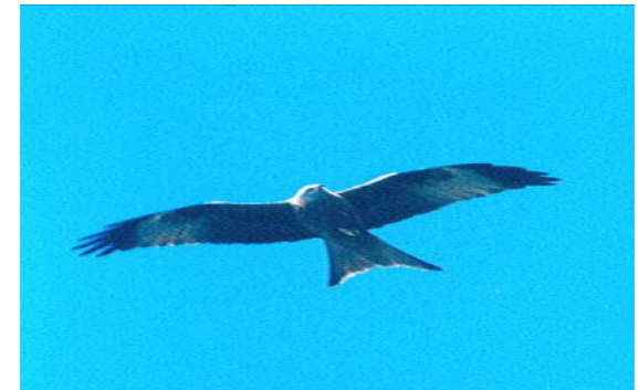
Foto1. Milà ( Milvus milvus )

Amb l'estudi portat a terme per Félix de Pablo i el seu equip d'investigació durant aquests anys, s'ha constatat una forta davallada de la població, principalment provocada per l'enverinament d'exemplars adults. A partir de l'any 1999, sembla que la tendència clarament descendent es veu frenada i s'entra en un fràgil equilibri, sempre molt per davall del nombre d'efectius coneguts als anys 70 i 80. Cal destacar que es tracta d'una espècie declarada en perill crític d'extinció a les illes Balears segons els criteris de la Unió Internacional per a la Conservació de la Naturalesa (UICN).