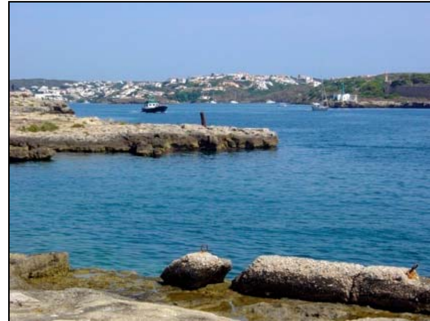
Foto 1. Port de Maó.

No obstant, per poder gestionar la primera passa és conèixer a fons la situació. A Menorca, en part a causa de la manca de llotja i en part a causa d'una manca d'interès en el passat, hi ha una absència total d'informació referent a flota pesquera i a captures fins a l'any 1996. A partir d'aquest moment la confraria de pescadors de Fornells comença a enregistrar aquestes dades; les confraries de Maó i Ciutadella ho fan un any més tard. Anualment, s'enregistren totes les barques que hi ha a cada port, el tipus d'art que empren, i una sèrie de dades característiques de cadascuna. Pel que fa a les captures, els propis pescadors declaren el que pesquen en cada dia de feina. S'ha pogut constatar, però, una molt baixa fiabilitat d'aquestes últimes; és per això que només presentem les dades de la flota pesquera amb les seves característiques principals. Val a dir que, actualment, des del "GOB Menorca s'està treballant en aquest tema per intentar aconseguir una aproximació a les dades reals de captures d'algunes de les espècies més comercials.